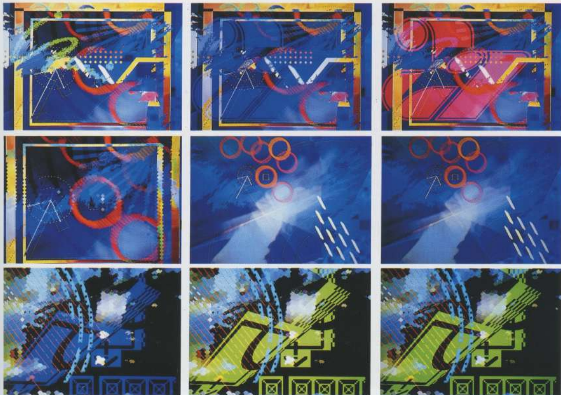
ONE DAYハレ後アメ hardware=PC9801-RA Super Frame2Σ software=SuperTableauPREMIUM